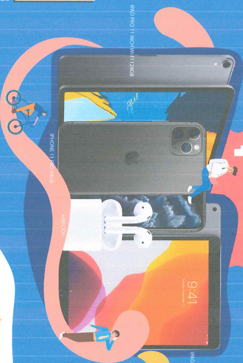
IPAD PRO 11 INCH W/LFI 128GB